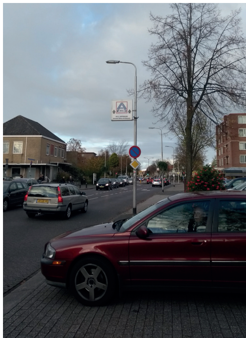
Drukke op de Leusderweg

Inmiddels ligt er een voorstel. Dat bevat onder meer: het aanbrengen van verkeersplateau's ter hoogte van de meeste kruisingen; op de kruising Javastraat/Voltastraat een kruispuntplateau met middengeleider; bij de supermarkten een verkeersplateau met dito geleider; venstertijden voor het laden en lossen op daarvoor gereserveerde parkeerplaatsen en de aanleg van fietsuggestiestroken. Tijdens een vergadering op het gemeentehuis in oktober werden alle punten door-