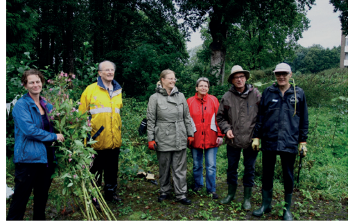
Op een natuurwerkdag

natuur alvast begonnen. Iedere tweede zaterdagochtend van de maand is er een natuurwerkdag. Vrijwilligers, met of zonder groene vingers, verzamelen zich dan bij Stadsboerderij de Vosheuvel. Nog niet het hele terrein is beschikbaar, maar er is genoeg te doen. Je kunt daarbij denken aan snoeien, onkruid weghalen, bomen planten of wilde bloemen zaaien. Ter afsluiting van zo'n ochtend is er, voor wie wil, een gezamenlijke lunch. Een enthousiaste vrijwilliger vertelt: "Je bent buiten, betrokken bij de buurt en je ontmoet nieuwe mensen."