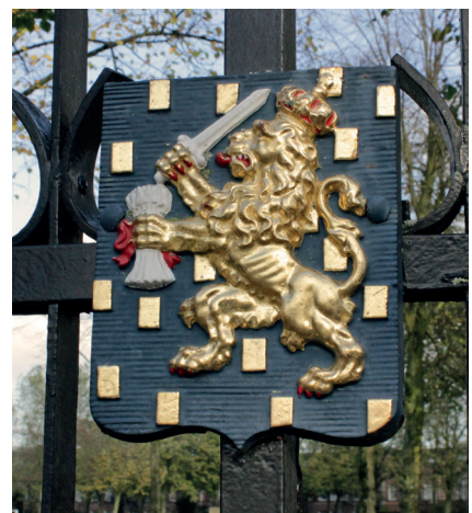
Het Amersfoortse wapenschild en het wapenschild van het Koninkrijk