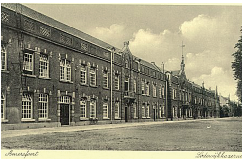
Oude ansichtkaart Lodewijk kazerne

Een tweede protest kwam van Kazerne Kraak Kollektief Amersfoort Drieka, die in 1980 probeerde de kazernegebouwen te bezetten. De krakers protesteerden tegen de snelle sloop van 'veel bruikbare ruimte', waardoor het terrein lang braak zou liggen en tegen de plannen om er dure huizen neer te zetten. Hun actie was geen succes, maar 150 van de verwachte 2000 actievoerders kwamen opdagen.