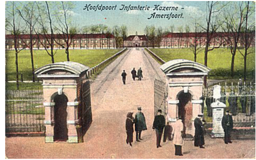
Oude ansichtkaart met hoofdingang kazerne-terrein aan de Leuserweg