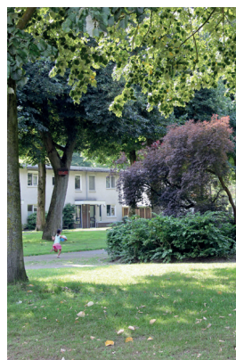
Juliana van Stolbergpark