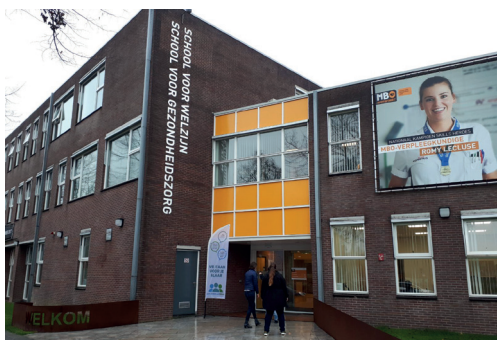
MBO Amersfoort