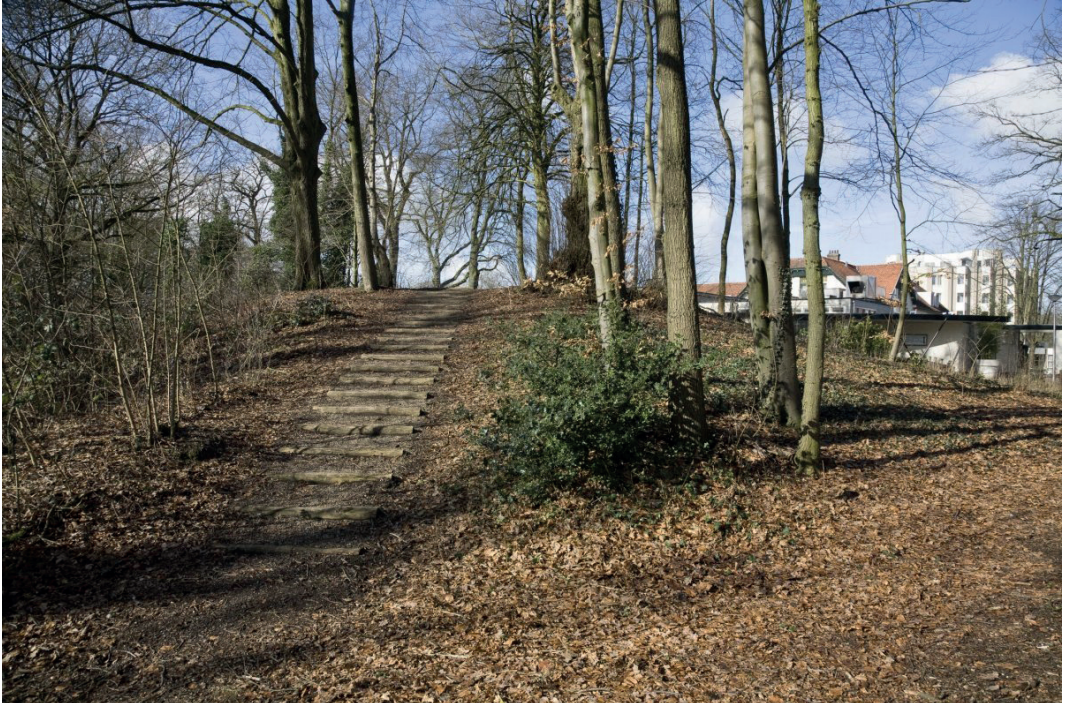
Galgenberg; zicht op het terrein, foto Rijksdienst Cultureel Erfgoed

Daar, waar nog nauwelijks begroeiing was, stond een stenen driehoekig bouwsel met zuilen op iedere hoek. Aan de stangen daartussen werden de lijken aan haken opgehangen. Soms ging het anders. Soldaat Alfonso Hermandes, die op de Metgensbleek de bleker, herbergier Maes, zijn twee zoons en een dienstmeisje had vermoord, werd er met rad en al op een paal neergezet. (De vrouw van Maes, Metgen, vandaar Metgensbleek, wist op tijd aan de moordpartij te ontkomen.) En het hoofd van Fie Dirksdochter, die ene Lambertje had vermoord en na het radbraken ook nog eens werd onthoofd, werd er neergezet op een pin. Vielen de gehangenen eraf, bij storm bijvoorbeeld, dan hing men ze gewoon weer op!