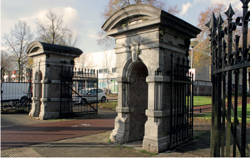
Wachhuisjes hoofdingang aan de Leuserweg nu