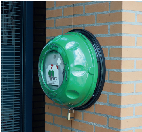
AED aan de muur

Op dit moment haalt onze wijk namelijk niet de gestelde norm van de Stichting Reanimatie Netwerk Amersfoort: het binnen zes minuten helpen van slachtoffers van een hartstilstand en daarmee hun overlevingskans substantieel vergroten.