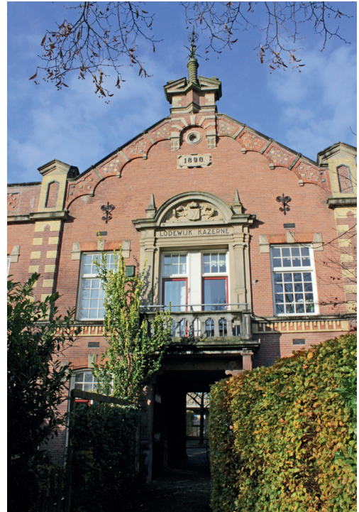
Hoofdingang voormalige Lodewijkkazerne met doorsteek