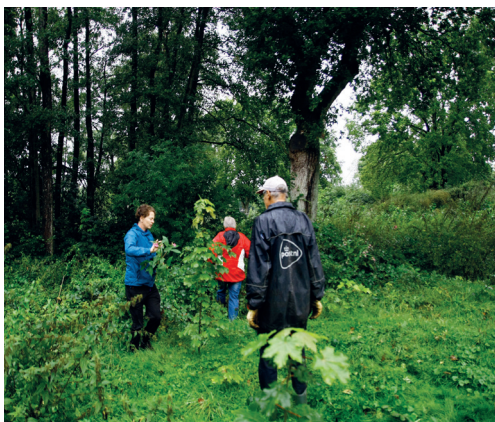
Vrijwilligers in actie, foto Bert Vos

Ondanks dat de sloop van het ziekenhuis nog moet beginnen, is de stichting in de